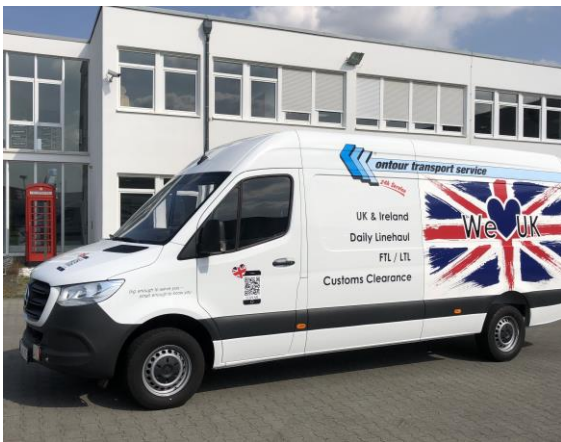
Foto: Das neueste Flottenmitglied, ein Mercedes Sprinter, ist gebrandet im aktuellen UK-Style. Kürzlich hinzugekommen sind darüber hinaus noch zwei weitere Caddys.