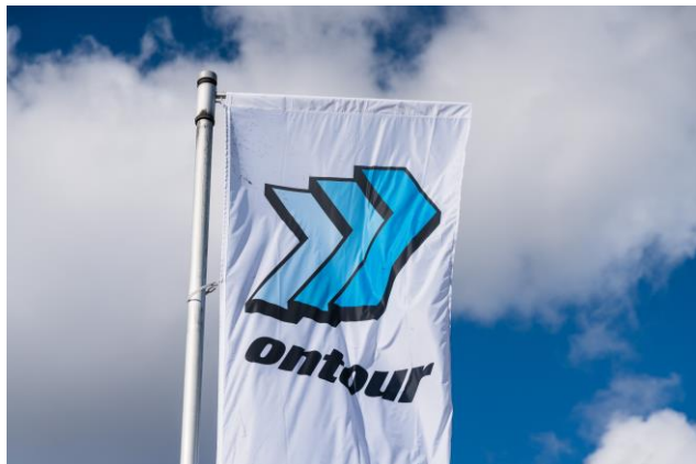
Foto: ontour blickt nach dem ersten Quartal 2021 weiterhin hoffnungsvoll in die Zukunft.

Die Entwicklung zeigt aber auch, dass das Unternehmen mit seinen Hygienemaßnahmen und seiner Teststrategie richtig liegt und so einen möglichst reibungslosen Betriebsablauf für seine Mitarbeiter und Kunden sicherstellt. Sehr erfreulich ist zudem, dass bereits rund 50 Prozent der ontour-Belegschaft geimpft werden konnten.